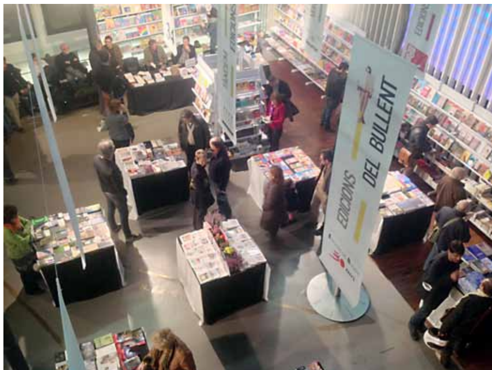
La Plaça del Llibre, al hall de l'Octubre CCC.

Aquesta és la primera vegada que s'organitza una setmana del llibre en català al País Valencià, que s'ha dut a terme sense cap mena de suport per part de les institucions públiques valencianes. El balanç positiu, tant des del punt de vista d'assistència de públic, com de vendes i repercussió, permet als organitzadors plantejar-se la continuïtat de la iniciativa l'any vinent.