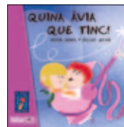
Quina àvia que tinc! Núria Homs Ed. Baranova (Conte infantil)