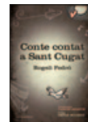
Conte contat a Sant Cugat Rogeli Pedró Cossetània Edicions (Contes)