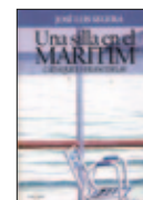
Una silla en el Maritim Cadaqués, verano del 80 José Luis Segura Ed. Punto Rojo (Novel·la)